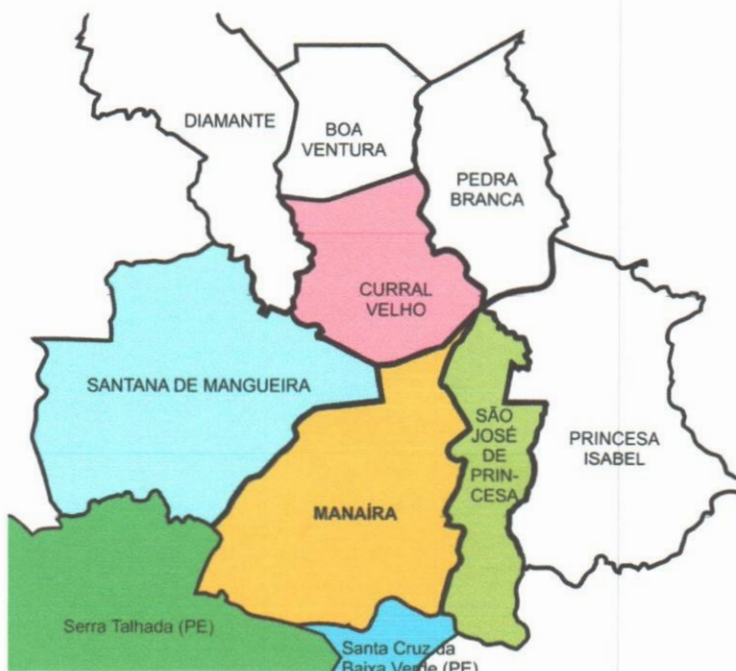
Mapa de Limites Do Município de Catolé Do Rocha