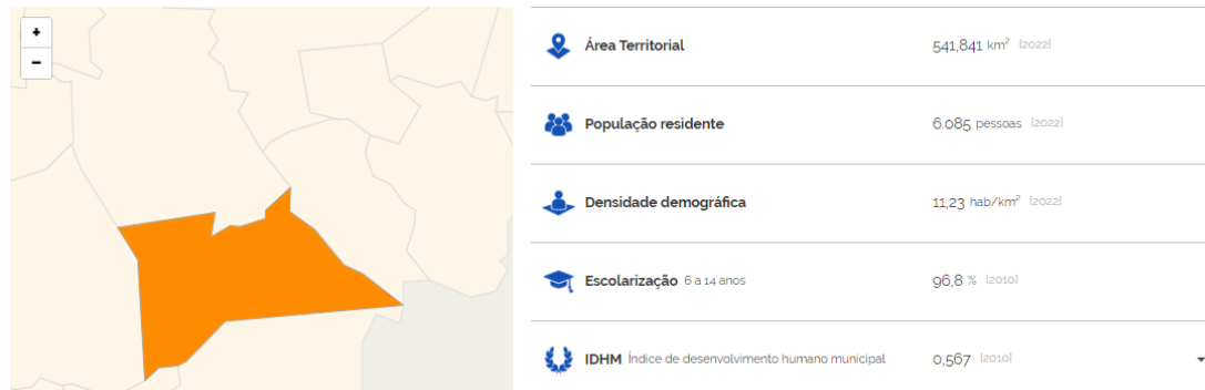
Figura 1 - Mapa territorial do município