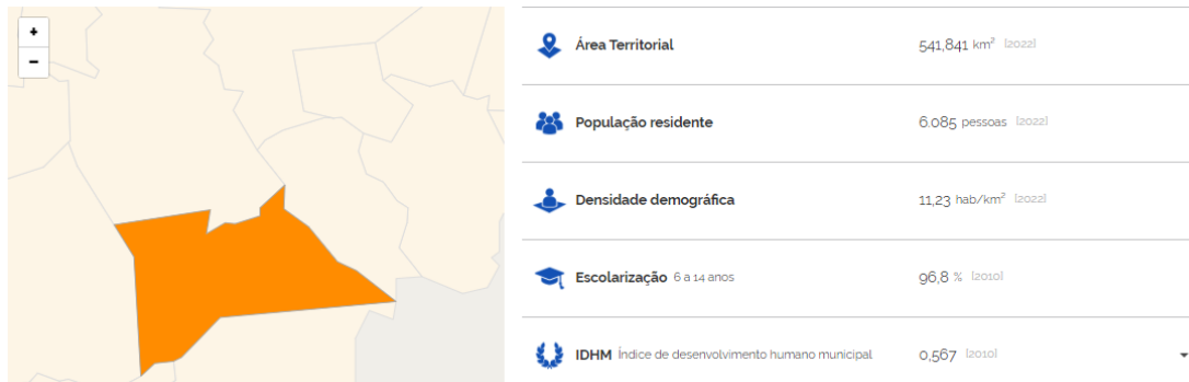
Figura 1 - Mapa territorial do município