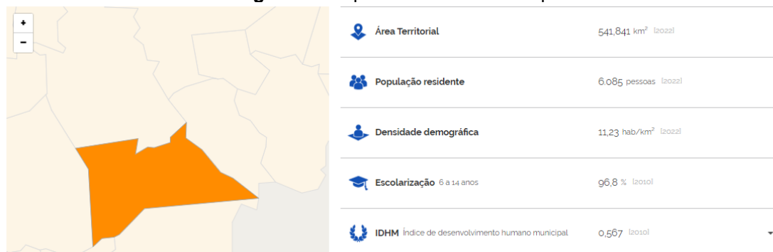
Figura 1 - Mapa territorial do município