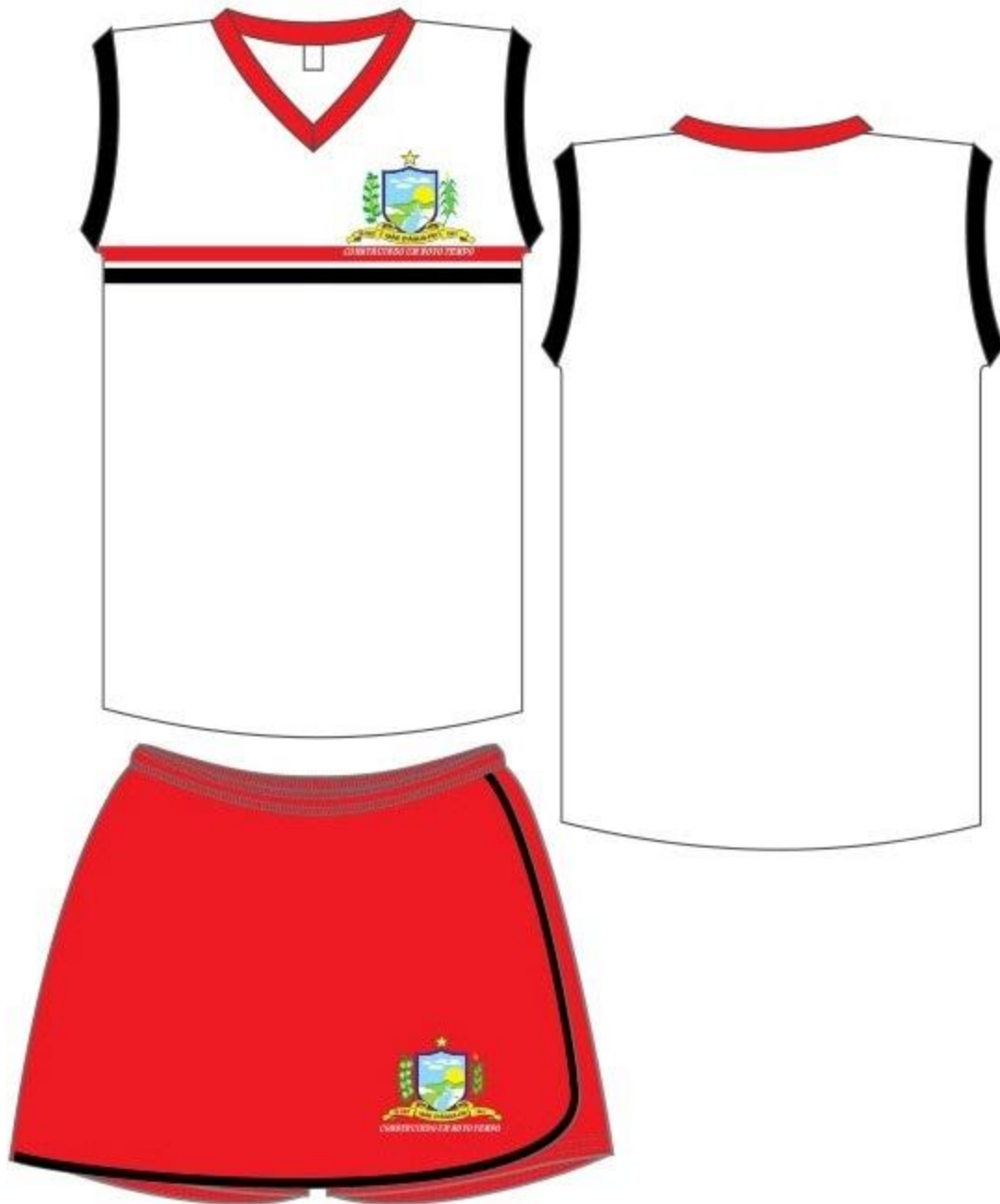
ILUSTRAÇÃO REFERENTE AOS ITENS: 1, 3, 5, 8, 9 e 10.