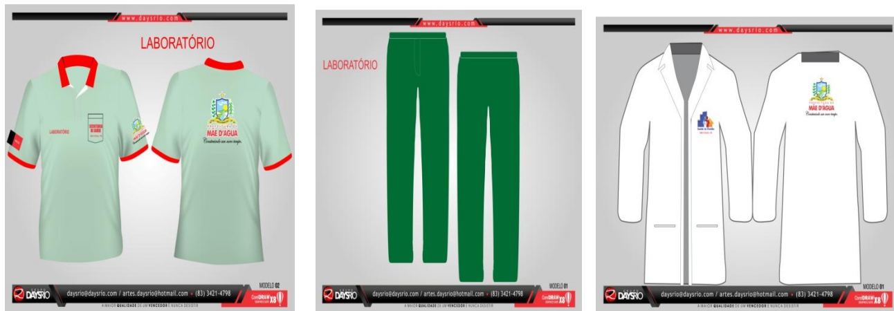
Tabela de uniformes dos profissionais da Saúde Laboratório

Observação: O bolso do Jaleco ser igual ao da camisa. Colocar a Identificação do lado esquerdo : Laboratório ( sendo 1 G e 1 GG) ,e UM JALECO ESPECIFICAR : BIOQUÍMICA (tamanho G), o design do bolso igual ao da camisa!