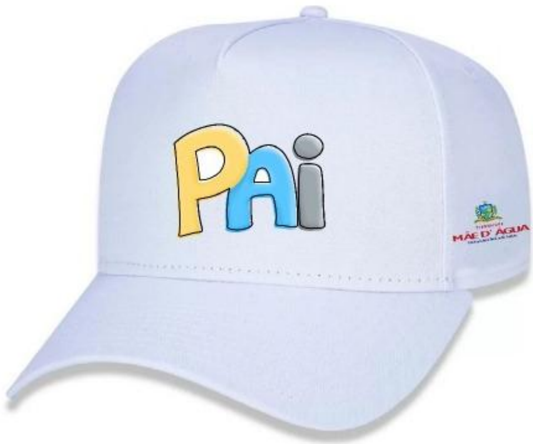
ILUSTRAÇÃO REFERENTE AO ITEM: 40