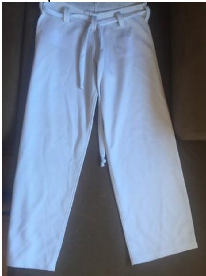
ILUSTRAÇÃO REFERENTE AO ITEM: 11