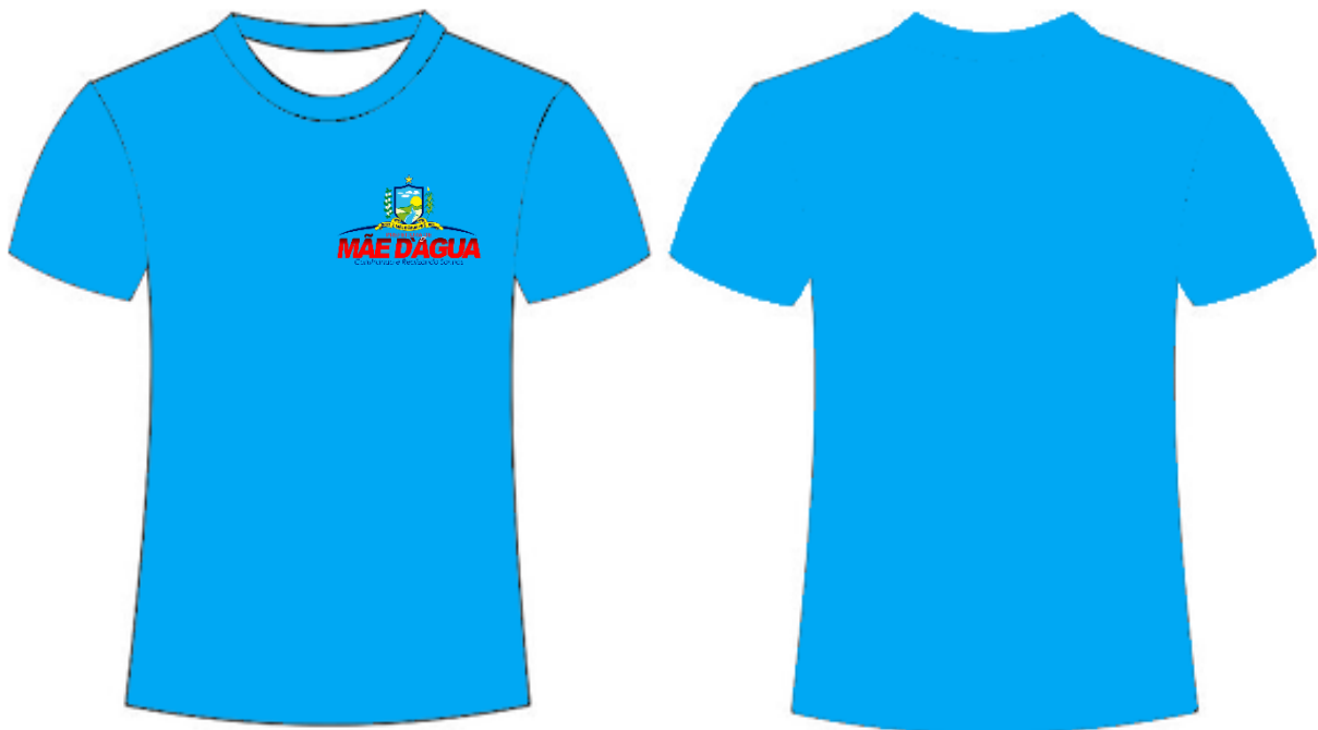
ILUSTRAÇÃO REFERENTE AO ITEM: 7