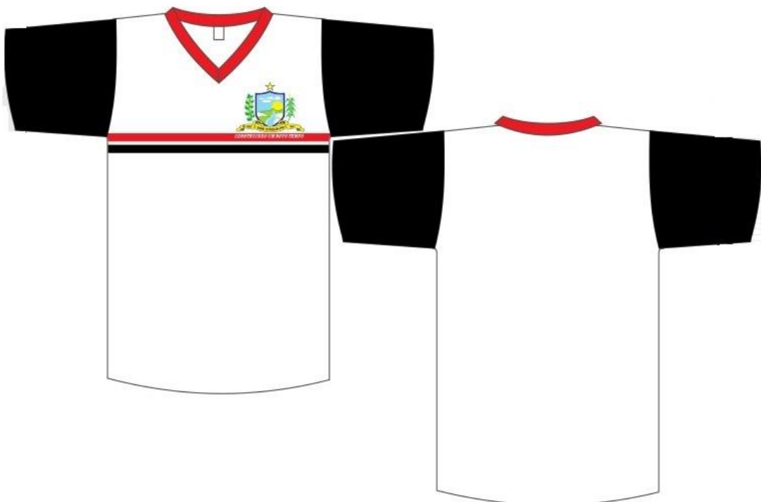
ILUSTRAÇÃO REFERENTE AO ITEM: 5