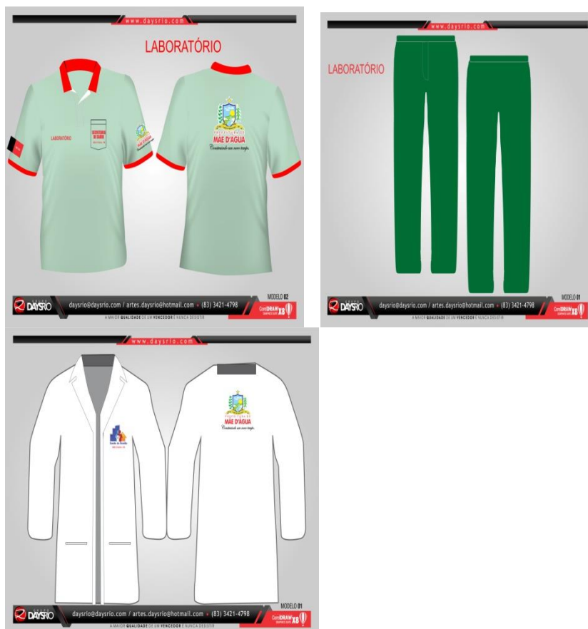
Tabela de uniformes dos profissionais da Saúde Laboratório