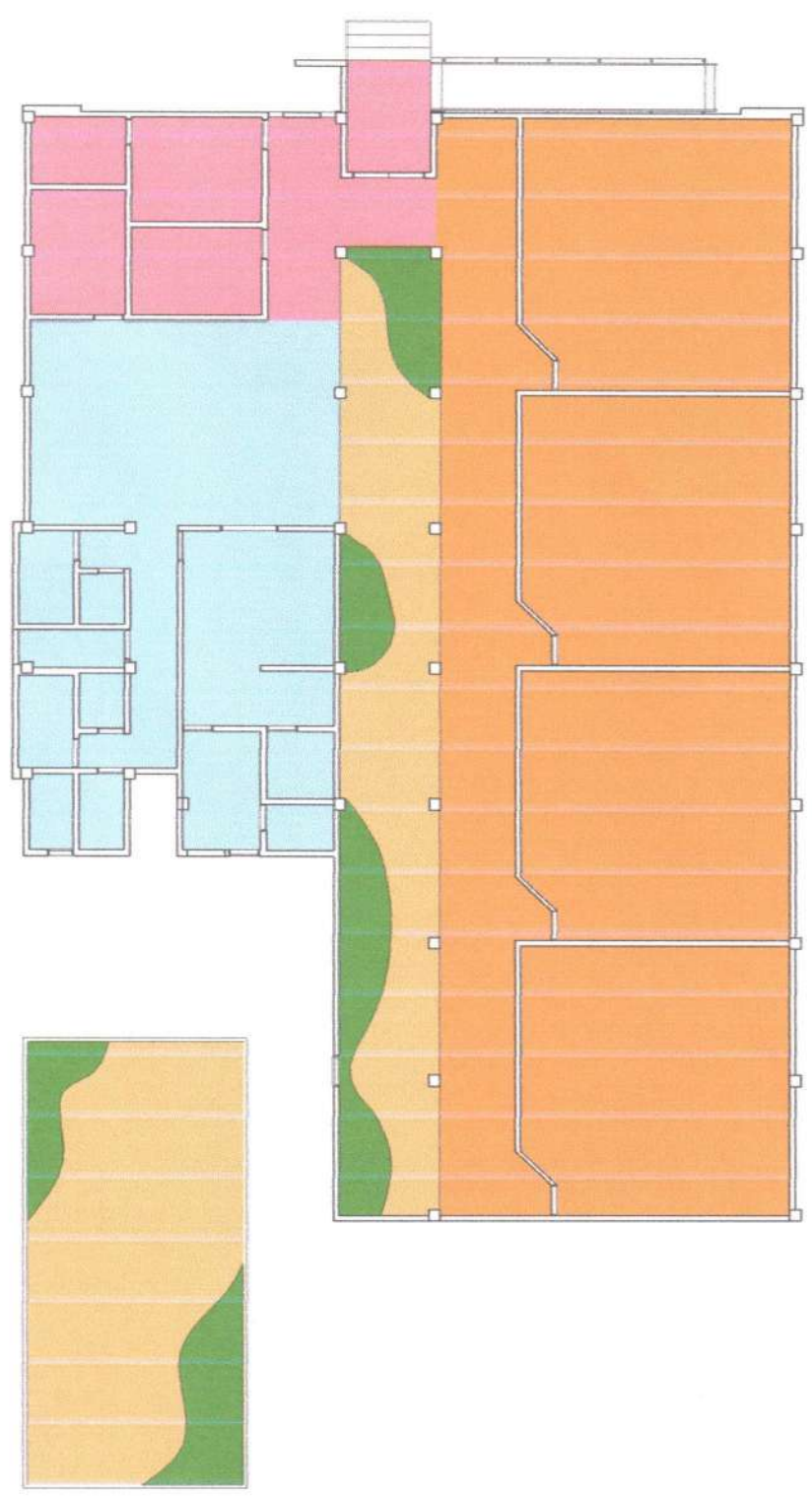
MAPA DE USO LEGENDA: